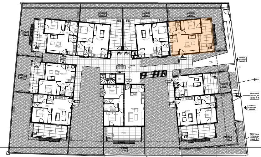
Localisation dans opération