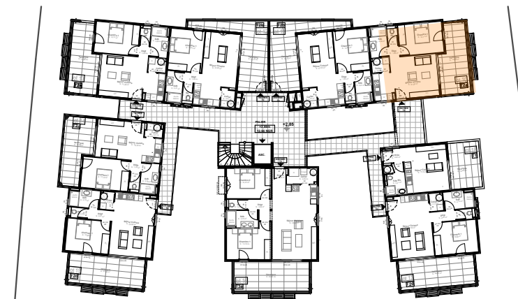
Localisation dans opération