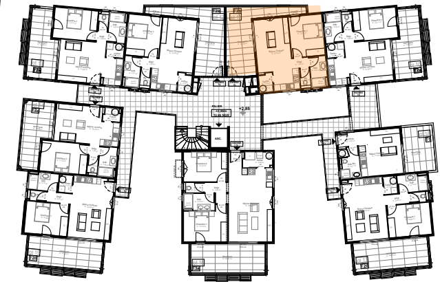
Localisation dans opération