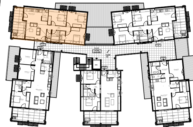
Localisation dans opération