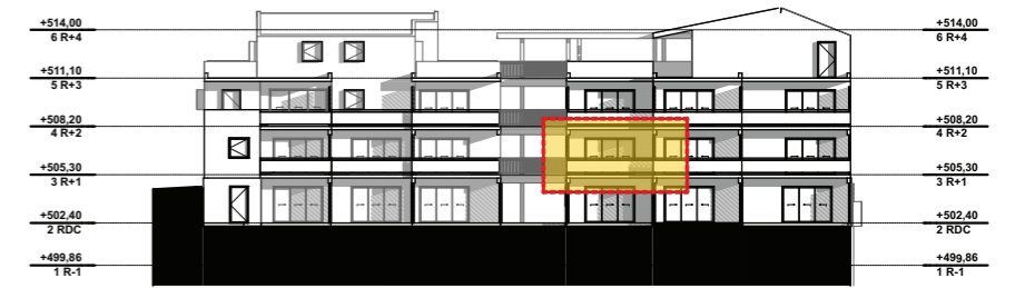
NIVEAU 1 - R+1