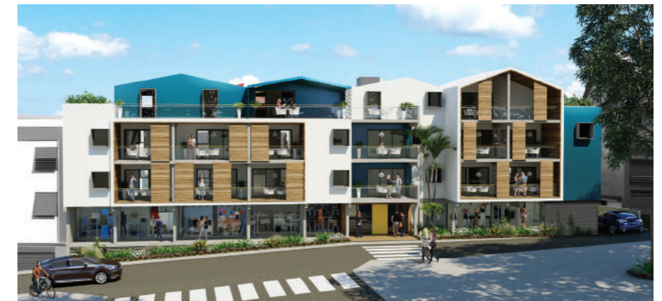
Surface Habitable 51,1m 2