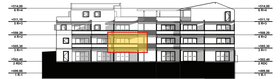
NIVEAU 1 - R+1