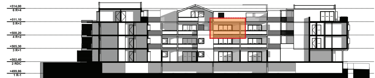
NIVEAU 2 - R+2