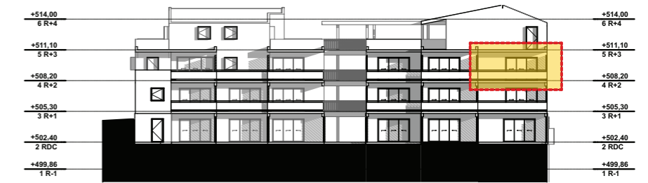
NIVEAU 2 - R+2