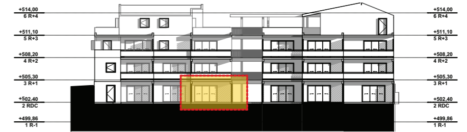
NIVEAU 0 - RDC