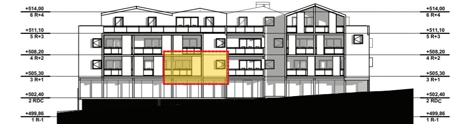
NIVEAU 1 - R+1