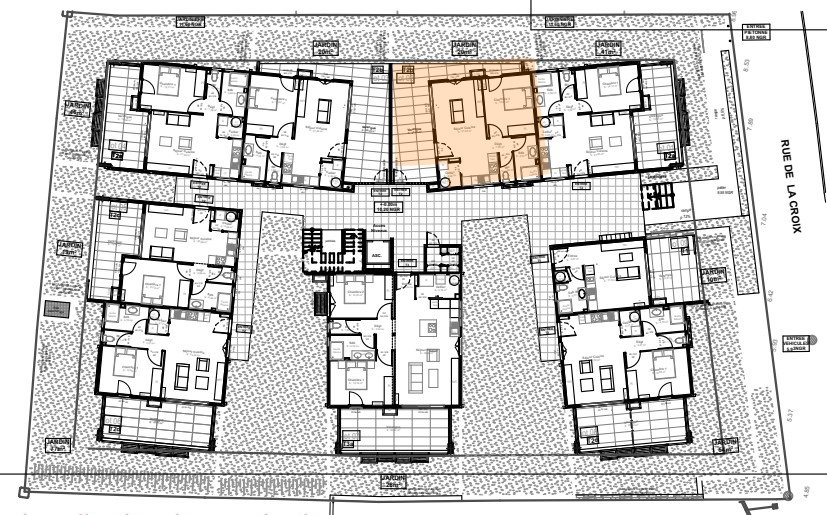
Localisation dans opération