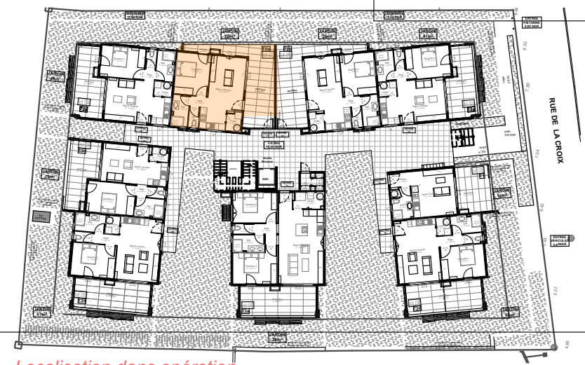
Localisation dans opération