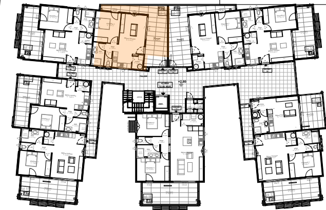
Localisation dans opération