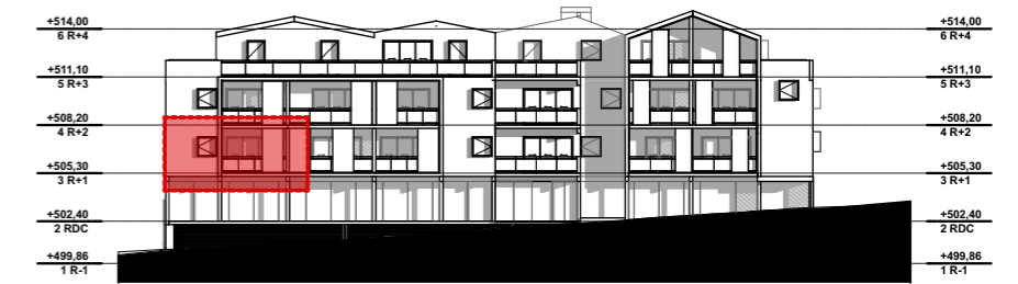
NIVEAU 1 - R+1