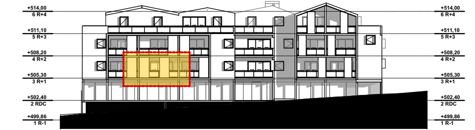
NIVEAU 1 - R+1