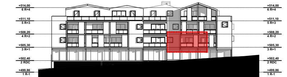
NIVEAU 1 - R+1