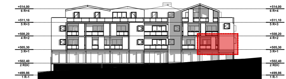
NIVEAU 1 - R+1