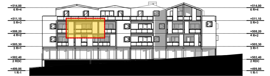
NIVEAU 2 - R+2