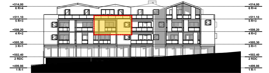
NIVEAU 2 R+2