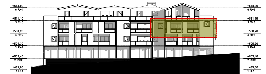
NIVEAU 2 - R+2