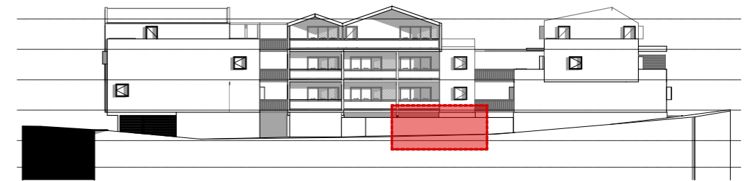
NIVEAU 0 - RDC