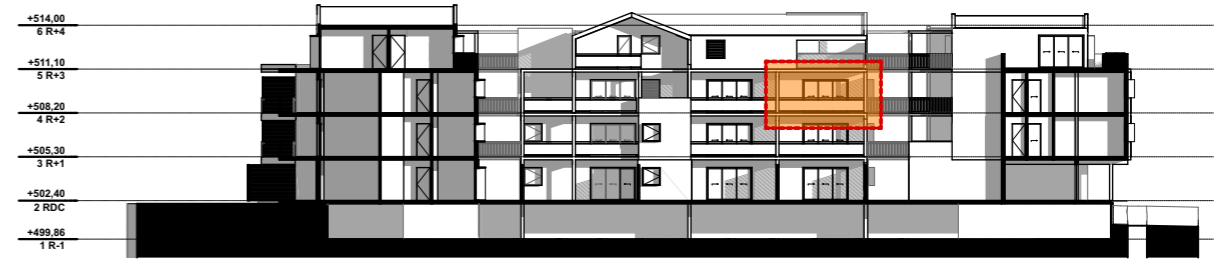
NIVEAU 2 - R+2