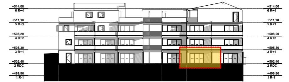
NIVEAU 0 - RDC