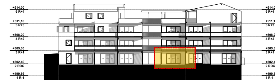
NIVEAU 0 - RDC