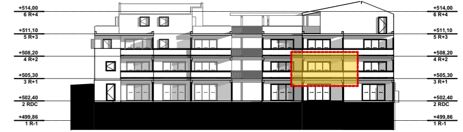
NIVEAU 1 - R+1