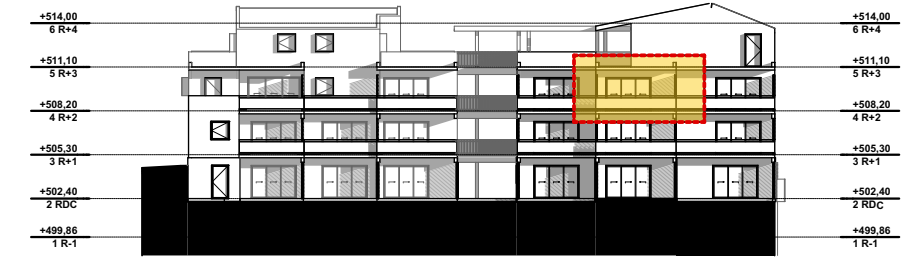
NIVEAU 2 - R+2