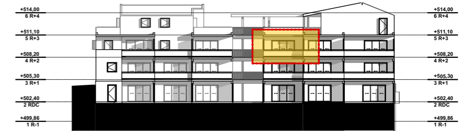
NIVEAU 2 - R+2