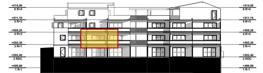
NIVEAU 1 - R+1